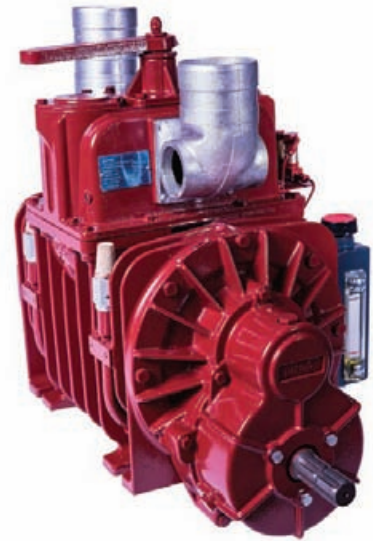
Abmessungen (mm) Dimensions (mm)